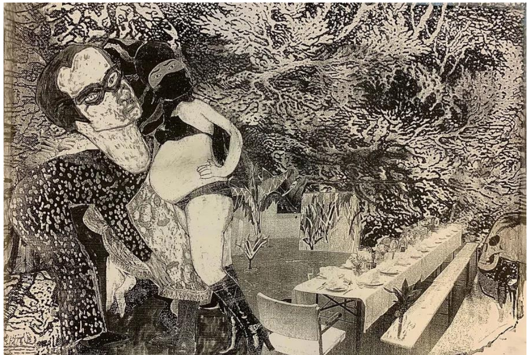
דב אור-נר, הדפס מתוך הסדרה "ידידתי, קורונה", 2020

"לא הצלחתי להתנגד לו", אמר אור-נר בראיון, כשהוא מתכוון להיטלר. "אני חי איתו. הדרך היחידה לחיות איתו היא להפוך אותו לידיד, זו הדרך שלי להתמודד עם פחדים. אני מודע לזה שאנשים מתייחסים לכך ברתיעה, אבל אני חייב להיות נאמן לביטוי העצמי שלי ולמה שאני חושב וחש."