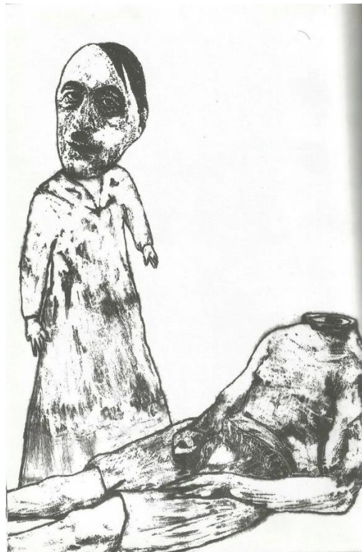
דב אור-נר, "בד הנרוא", 2010