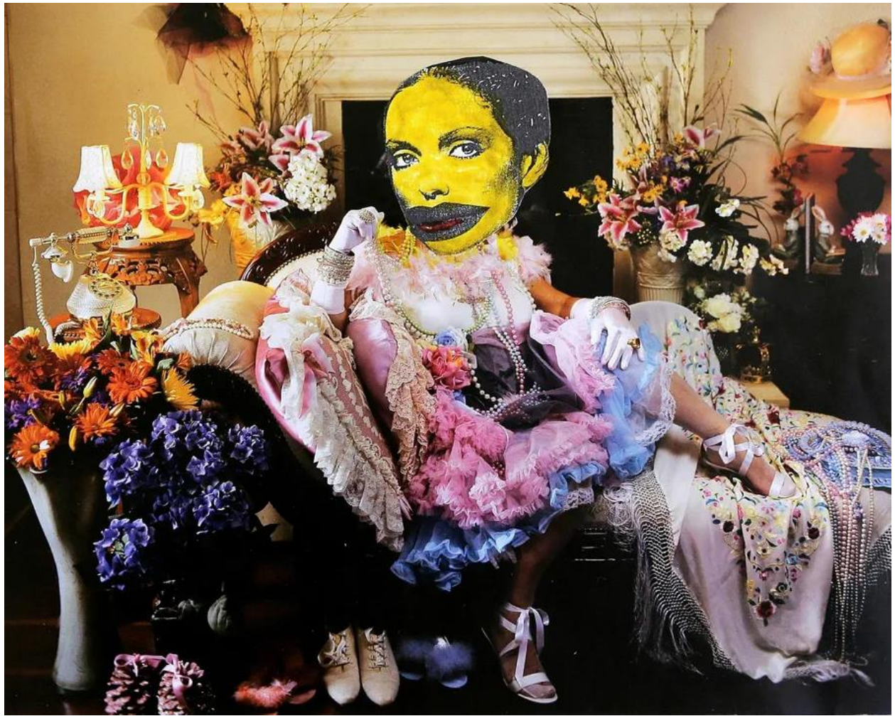
דב אור-נר, הדפס מתוך הסדרה "ידידתי, קורונה", 2020