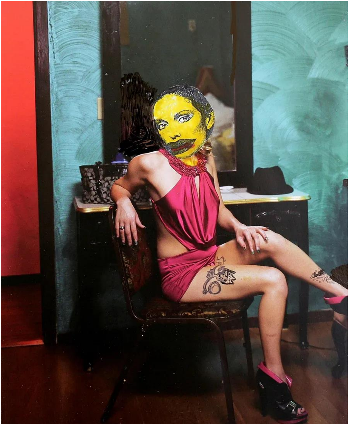
דב אור-נר, הדפס מתוך הסדרה "ידידתי, קורונה", 2020

אור-נר היה אוטוידידקט. למעט לימודי אמנות אצל רודי להמן בגבעתיים, הוא התפתח באופן עצמאי יחד עם אמנים ואוצרים שפגש לאורך הדרך. החל משנות ה-70 הוא היה פעיל בשדה האמנות הקונספטואלית ונחשב לאחד ממייסדי הסגנון בישראל. כיוצר הצליח לבסס דרך חשיבה חדשה המחברת בין אמנות, חברה ודמוקרטיה. רוב הפעולות של אור-נר מופיעות בספר עב כרס "פעולות בפלנטה הקרובה 1970–2070", שפורסם ב-2014 בהוצאת הקיבוץ המאוחד, שכתבה וערכה האוצרת טלי תמיר . השנה העתידית לא היתה טעות, אלא חלק מחזון אמנותי להמשיך וליצור.