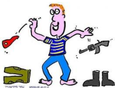
ברכות לשחרור מהצבא